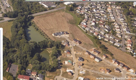
Attractivité / L'Europe Vue du Ciel