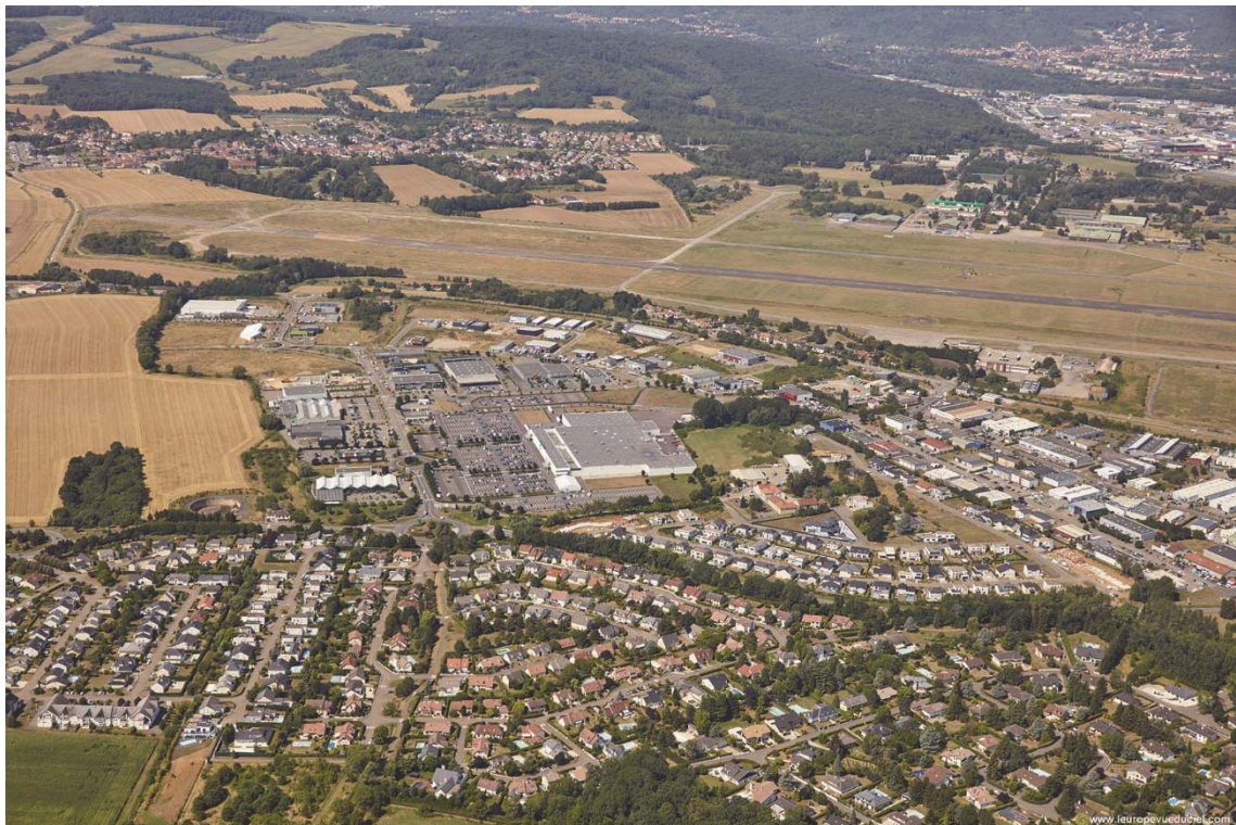
Marly « Belle Fontaine »