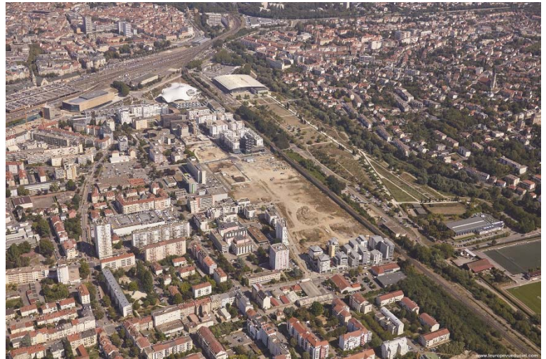
Quartier de l'amphithéâtre